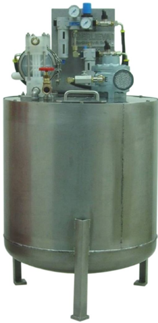
photo: réservoir 200 litres