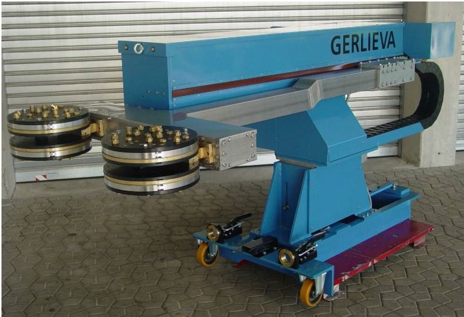
GSK 1400 mit Fahrrahmen und Sondersprühkopf für Schwenklager