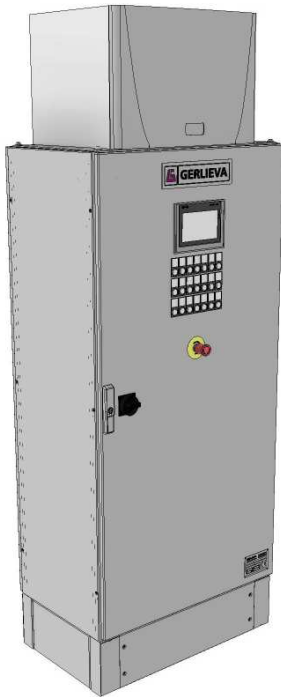
Schaltschrank mit Kühlgerät und Bedienfeld