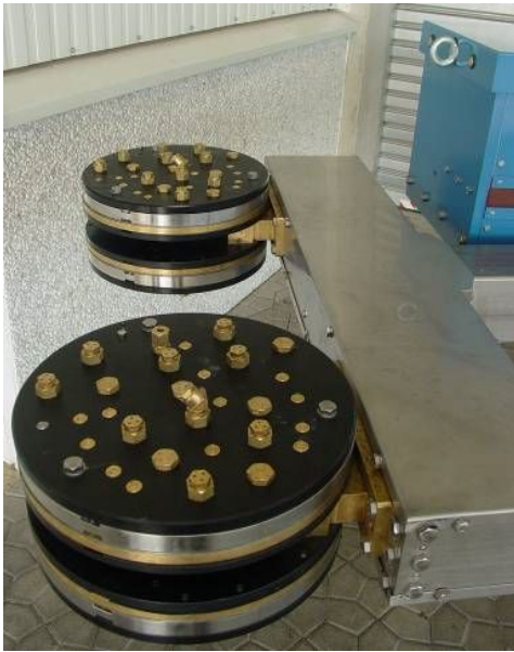
4-Kreis Sondersprühköpfe für Achsschenkel

für 2 Sprühmedien Medium 1: Wasser-Graphit Medium 2: Wasser