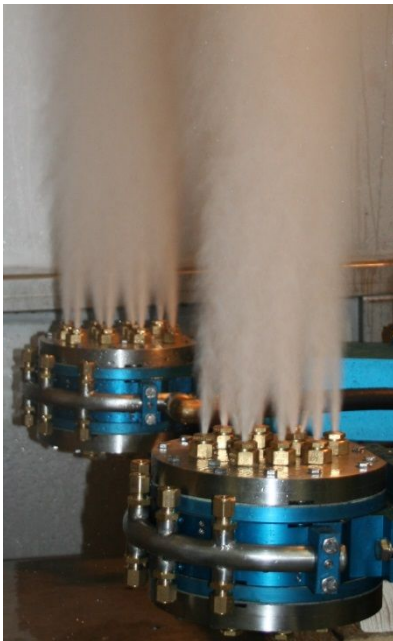
tête de pulv./souffl. spéciale

fonction "pulvérisation avec eau" pour améliorer le refroidissement des outils (option)