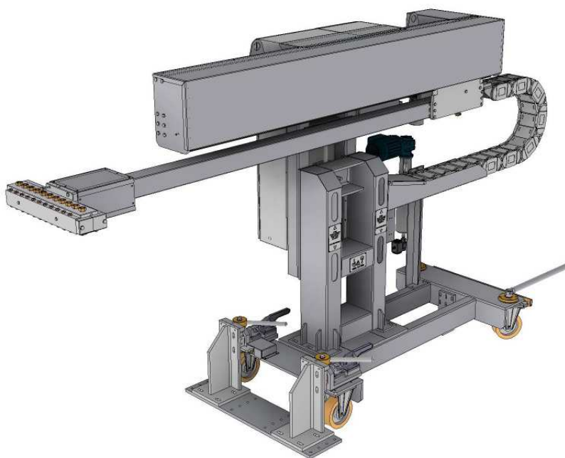
GSK-L 1500 avec support mobile et tête de pulvérisation standard