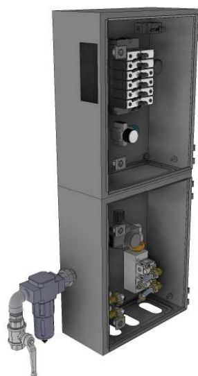
Vannes de commande raccordes d'alimentation régulateur pression et filtre